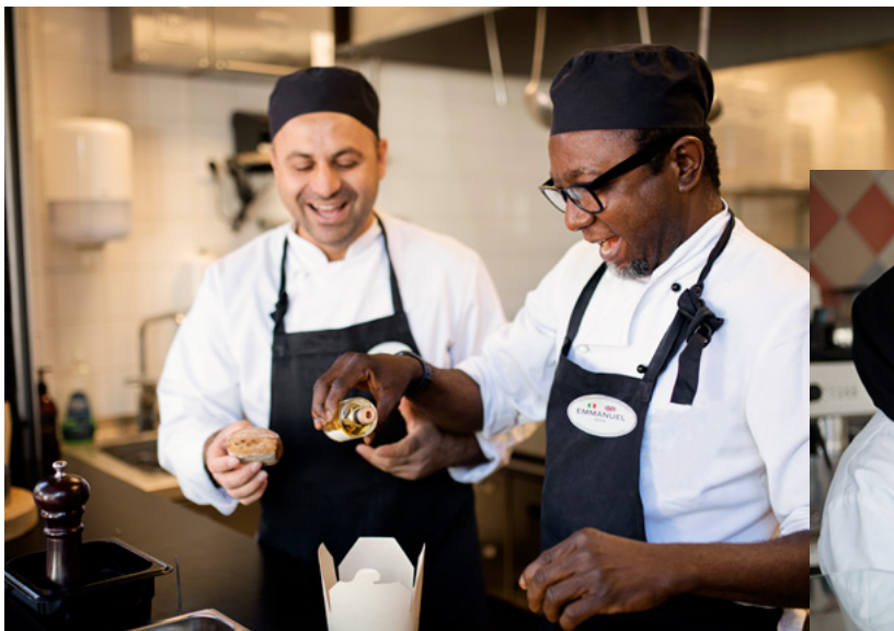
Kockar på Gröna Lund.